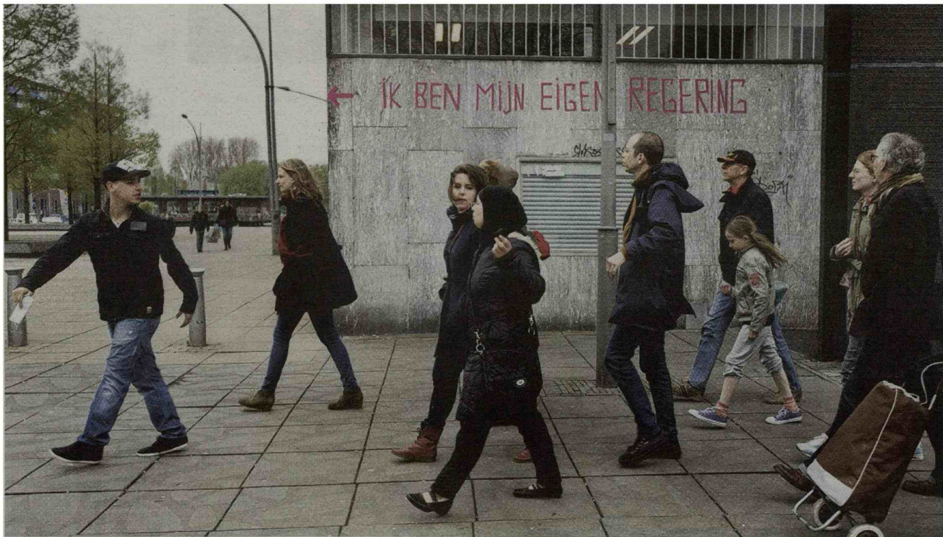
Elke groep die op WijkSafari gaat, ziet andere stukken van Slotermeer en andere theaterscènes.